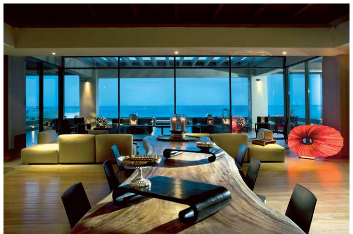
Die Lounge im Aquagrand auf Rhodos - mondänes Design mit Chill-Faktor.

Bahnhofstraße 30 • 94032 Passau Tel. 0851-955 66 0 • info@niedermayer-reisen.de • www.niedermayer-reisen.de